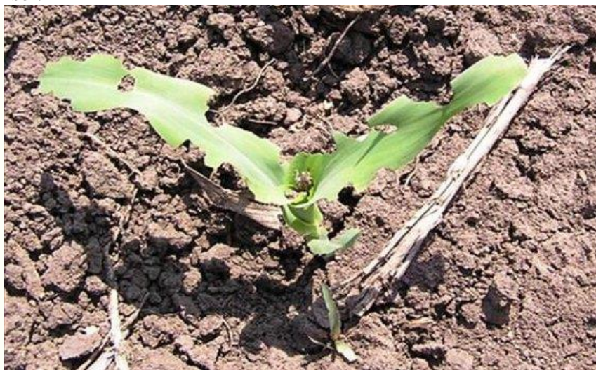
simptome de atac