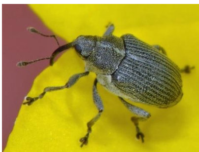
gargarita silicvelor ( Ceuthorrynchus assimilis )