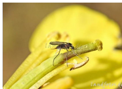
tantarasul silicvelor ( Dasineura brassicae )

Sunt daunatori care se hranesc cu organele florale.Insecticidele mentionate sunt eficiente si pentru combaterea acestor daunatori.Este foarte importanta aplicarea tratamentelor inainte de depunerea pantei.