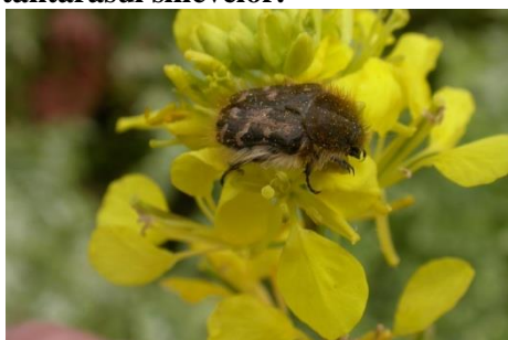
gandacul paros ( Epicometis hirta )

Alti daunatori care produc atac in cultura de rapita in aceasta perioada sunt: gandacul paros,gargarita silicvelor, tantarasul silicvelor.