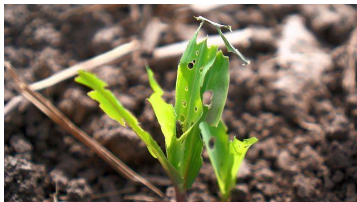
simptome de atac