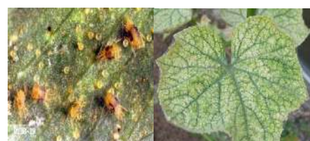
păianjenul roșu comun